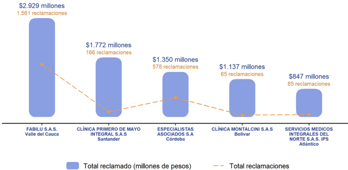
Figura 4. Total reclamado y número reclamaciones por vehículos fantasmas en cinco principales IPS (enero 2024)

Por último, la IPS FABILU S.A.S. (Valle del Cauca) presentó el mayor valor reclamado por vehículos fantasmas, con $2.929 millones, lo que representa el 51,8 % del total reclamado por esta IPS; seguida por la CLÍNICA PRIMERO DE MAYO INTEGRAL S.A.S con reclamaciones por $1.772 millones, que corresponden al 77 %. En tercer lugar, se encuentra la IPS ESPECIALISTAS ASOCIADOS S.A con $1.350 millones, correspondientes al 29,7 %.