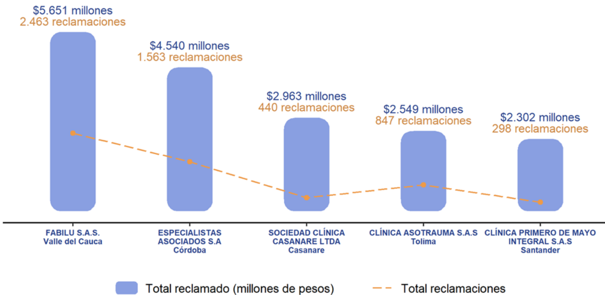
Figura 1. Total reclamado y número reclamaciones nuevas en cinco principales IPS (de enero 2024)