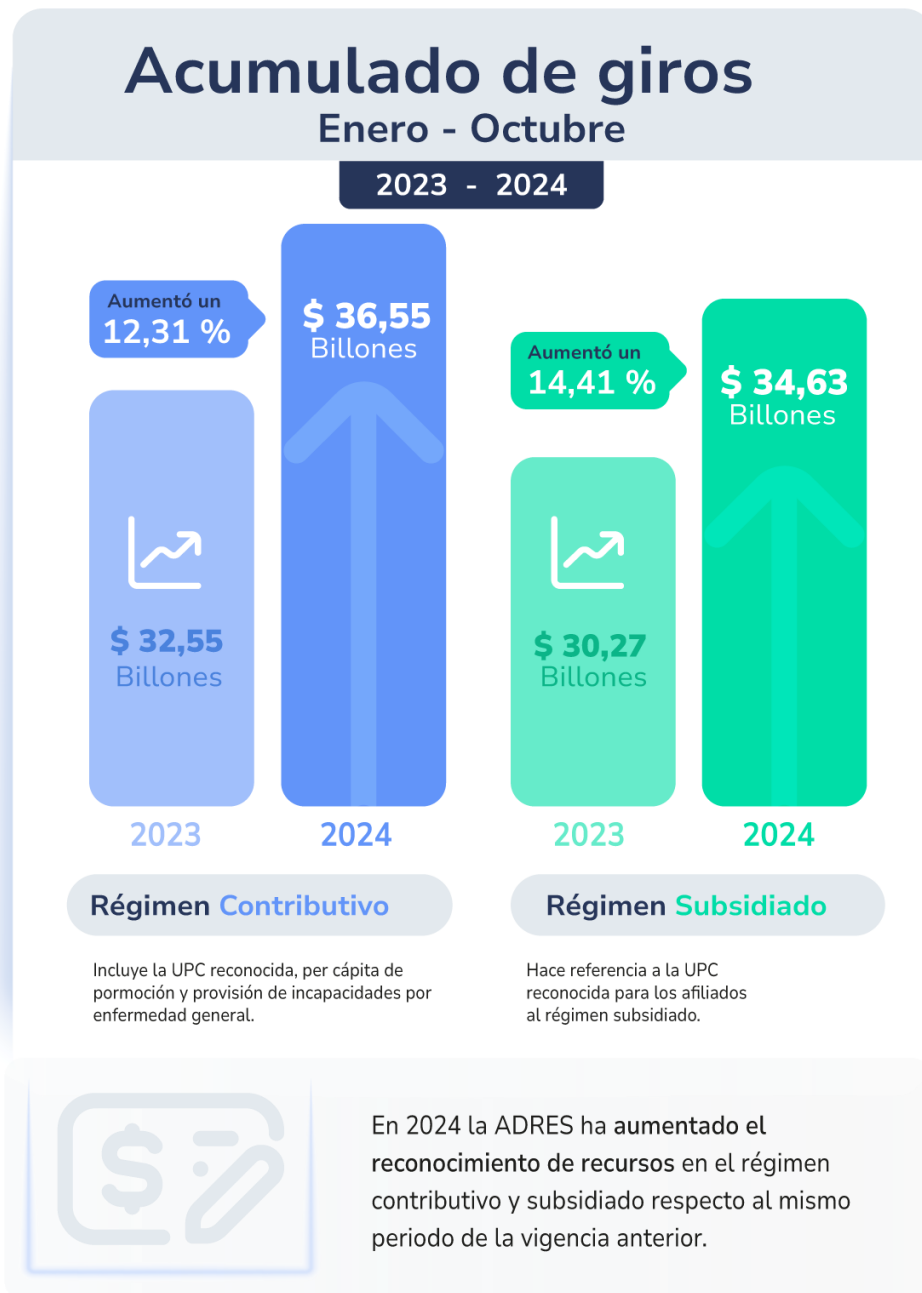
Gráfica 1. Valores del reconocimiento (2023-2024)

Fuente: Resultados de los procesos de Compensación y de LMA, regímenes contributivo y subsidiado