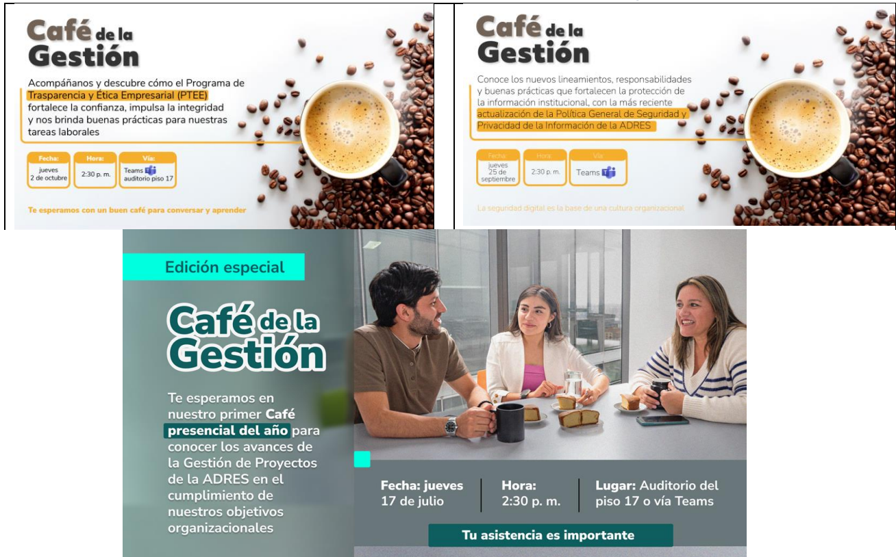
Ilustración 5: Piezas de comunicación del café de la gestión