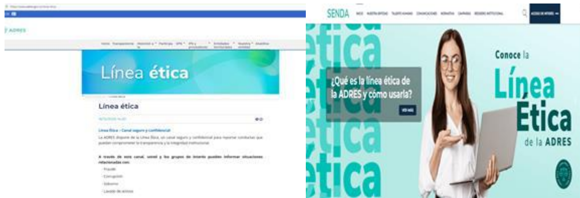
Ilustración 6 – Canal de la Línea Ética