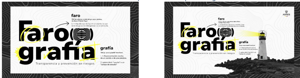
Ilustración 2: Concepto creativo campaña fotografía